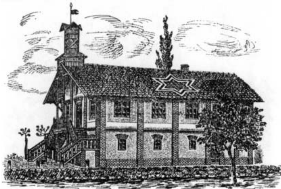
Spolkový dům - „Hasička“

Pozoruhodné je, že prvními členy Sokola byli příslušníci řad dělnických a živnostenských. Jednota byla založena, chyběla však tělocvična, jakékoliv nářadí a finanční prostředky. Výbor proto požádal místní školní radu o povolení